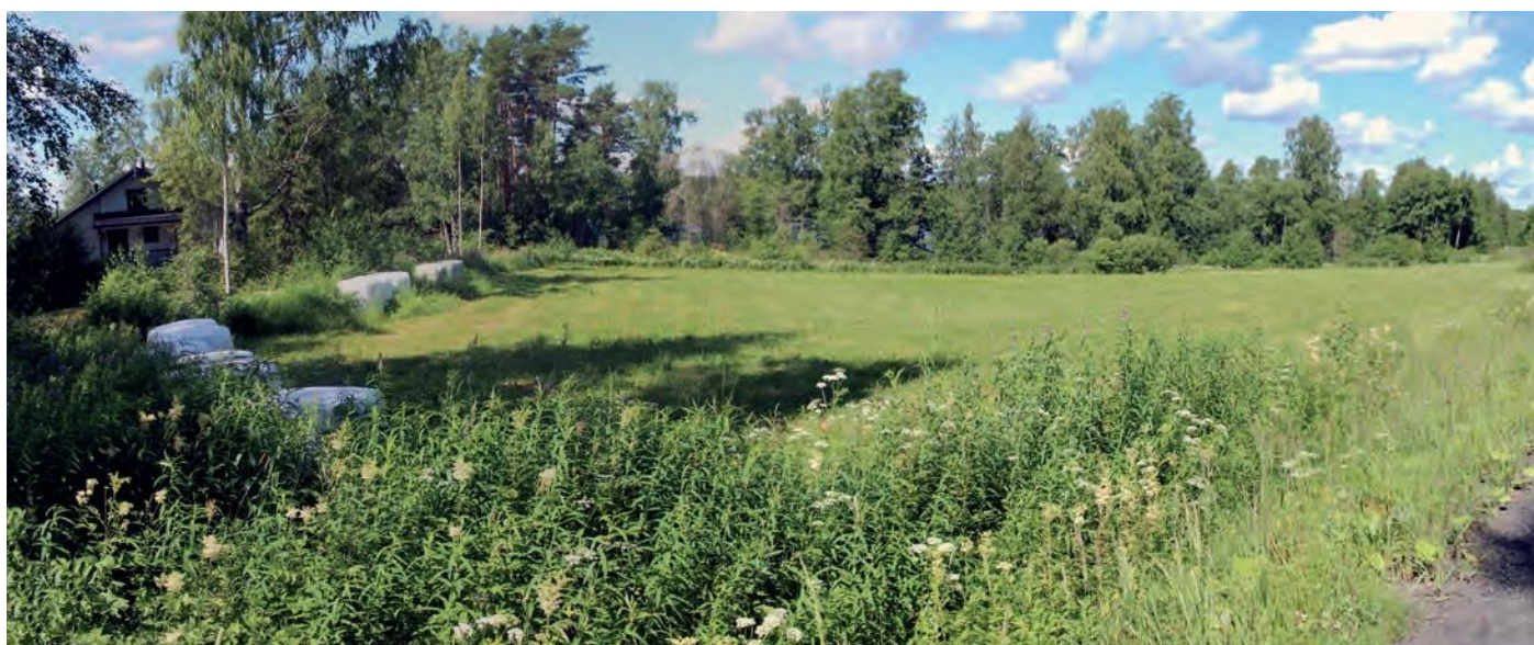
RA3-alue, yleiskuva. Kuva Kaakosta