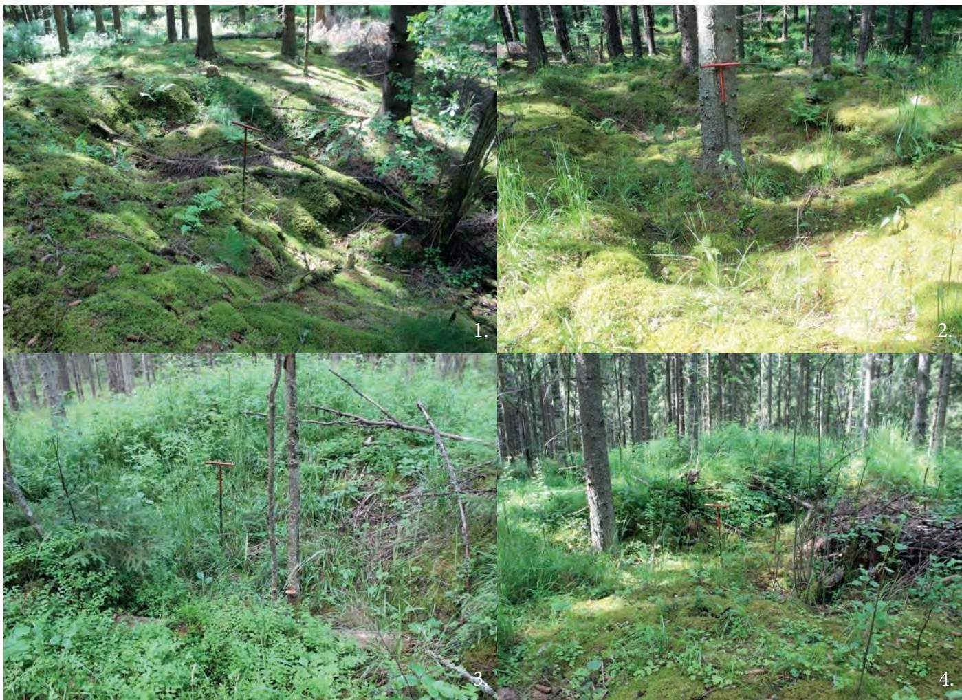
RA1-alueen tuntumasta havaitut kuopanteet 1 - 4.