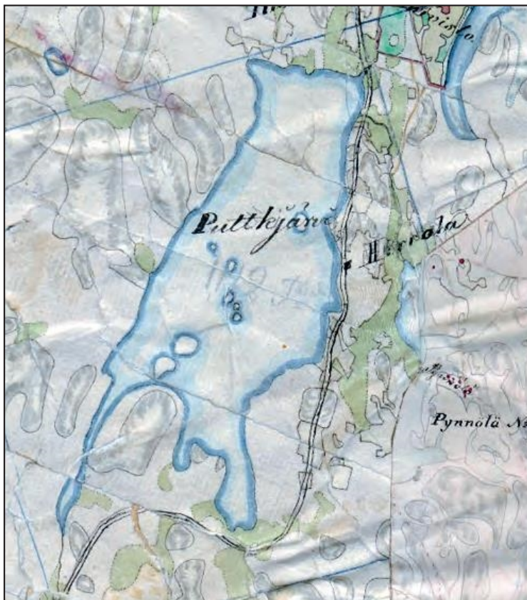
Suunnittelualue Pitäjänkartalla (3122 08 Ia.* -/- - Hartola)