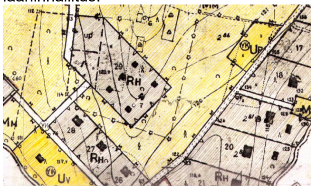
Kaava 2/ Suuruspään rantakaava

Vahvistettu 29.11.1971 Mikkelin lääninhallitus.