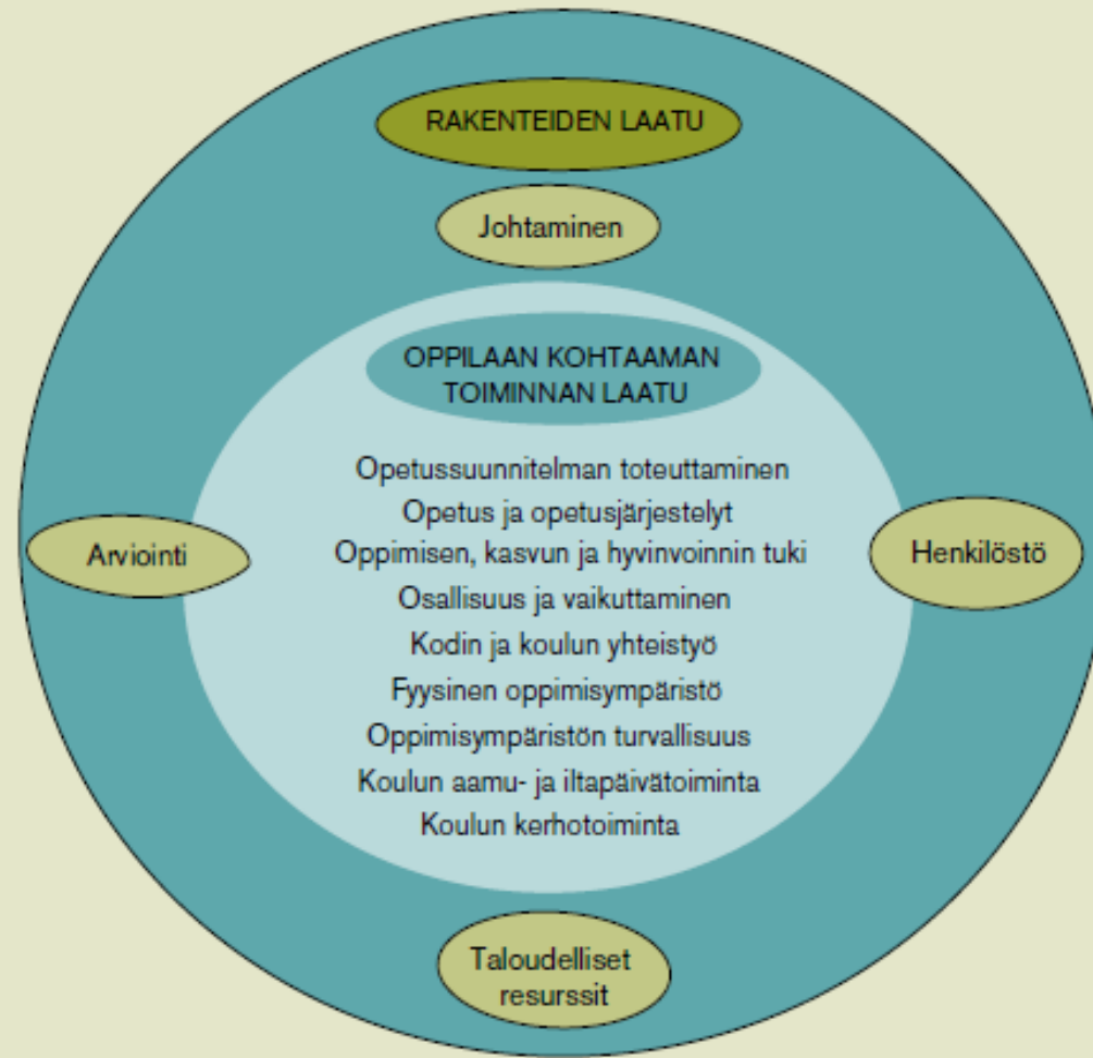
Kuvio 3. Perusopetuksen laatukriteereiden viitekehys.