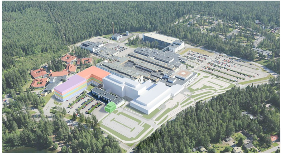
Kuva 1. Rakennusvaihe 8, vaihtoehto 1 (VE1)

Toteutussuunnittelun edetessä ja tarkasteltaessa VE1:n mukaista toimintojen sijoittumista RV8:aan, on VE1:ssä suunniteltu dogleg-muoto osoittautunut haastavaksi. Osa keskeisistä toiminnoista (keuhkosairauksien vuodeosasto, lastenyksiköt ja nuorisopsykiatria) sijoittuvat suunnitelmassa väistämättä kauas sairaalan ytimestä ja niihin joudutaan kulkemaan toisten toimintayksiköiden kautta. Lisäksi VE1:n mukainen toteutus vie lähes kokonaan pysäköintialue P3:n, vaatii merkittävän kaavamuutoksen ja tarvitsee väliaikaisen rakennusoikeuden ylityksen osalta rakennusoikeuden poikkeamisluvan. Toimintojen sijoittuminen rakennukseen VE1:n mukaisesti aiheuttaa pitkäaikaisen (40 - 50 vuotta) toiminnallisen haitan keskeisten yksiköiden sijoituessa kauas sairaalan ytimestä. Toteutussuunnitelman VE1:ssä ei ole tarvetta laajoille väistötilajärjestelyille.