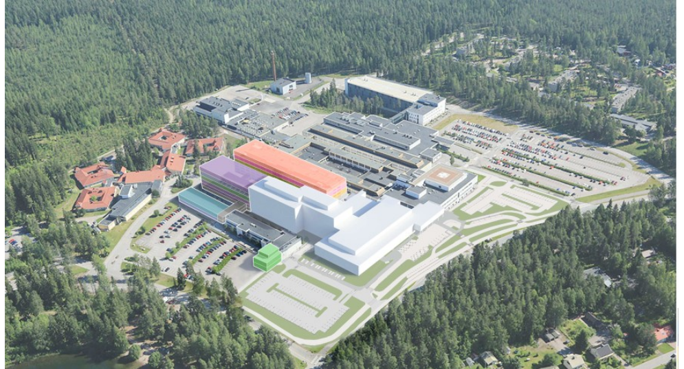
Kuva 3. Rakennusvaihe 8 (RV8), vaihtoehto 2 (VE2)

Kuvantamisen nykytilojen peruskorjausaste kevenee ja toimitilat saadaan polikliiniseen sekä päiväsairaaloiminnan käyttöön eikä kuvantamisen nykytilojen osalta tarvita erillistä, väliaikaista ilmastointikojeiden uusimista.